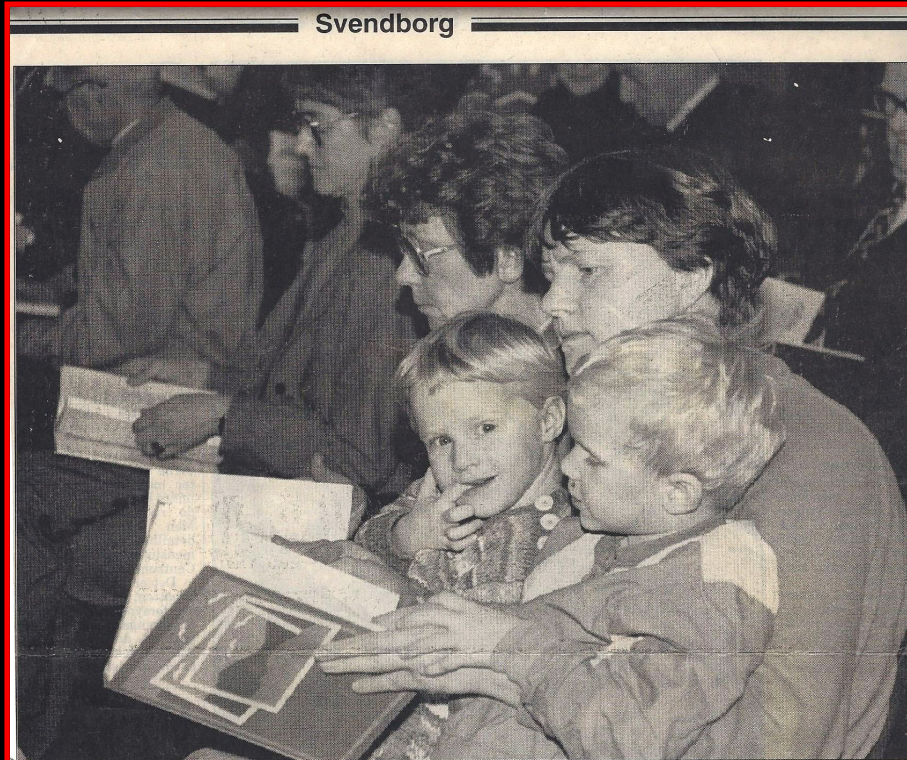
Små og store sang med efter de omdelte sangbøger. »Dansk Sang«, udgivet af Folkeskolens Musiklærerforening.