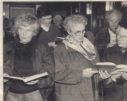
At synge stående giver god luft til udfoldelserne.

- Den danske sang er ikke stivnet. Den er levent-