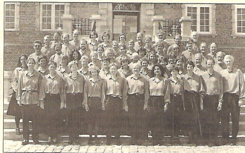
Det 65 personer store kor fra Svendborg synger Vivaldi i Faaborg og Svendborg.

Vivaldis 'Gloria' bliver hovedværket ved Septimus-korets to forårskoncerter, hvor repertoire desuden består af tre danske sange og udvalgte satser fra Stabat Mater af Perculesi.