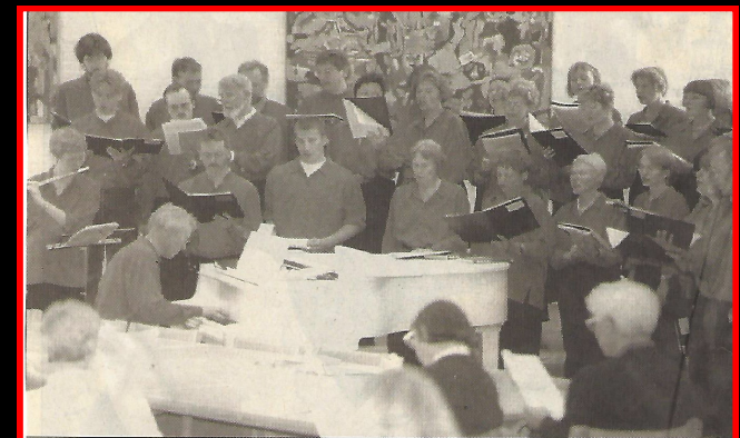
Septimuskoret sang oplagt for på eftermiddagens store udbud af sange.